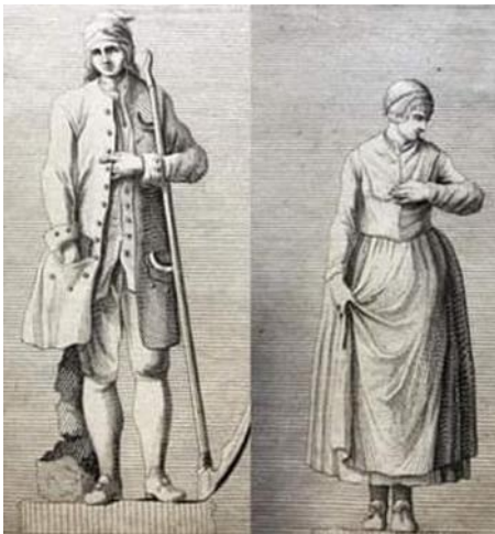
Paret fra Eger som står i Normannsdalen ved Fredensborg slott i Danmark. Den første dokumenterte folkedrakt fra Buskerud.