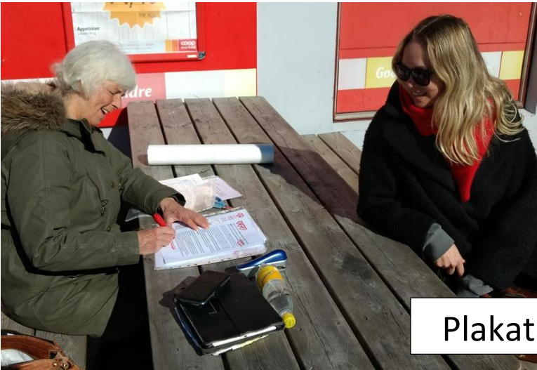
Plakatar blir til