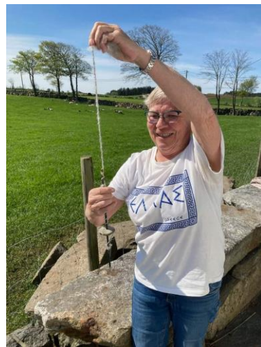
Liv Gerd spinner trå på spinnetein.