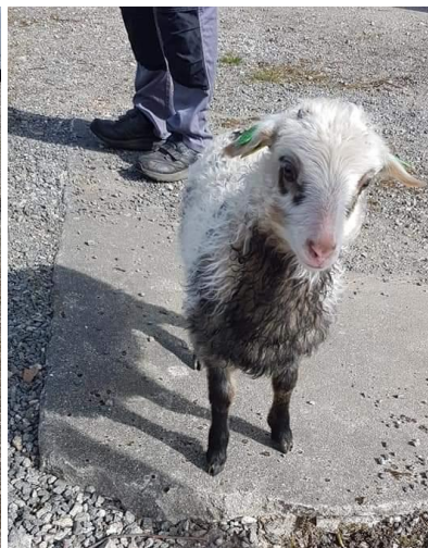
Norsk gammel spelsau.