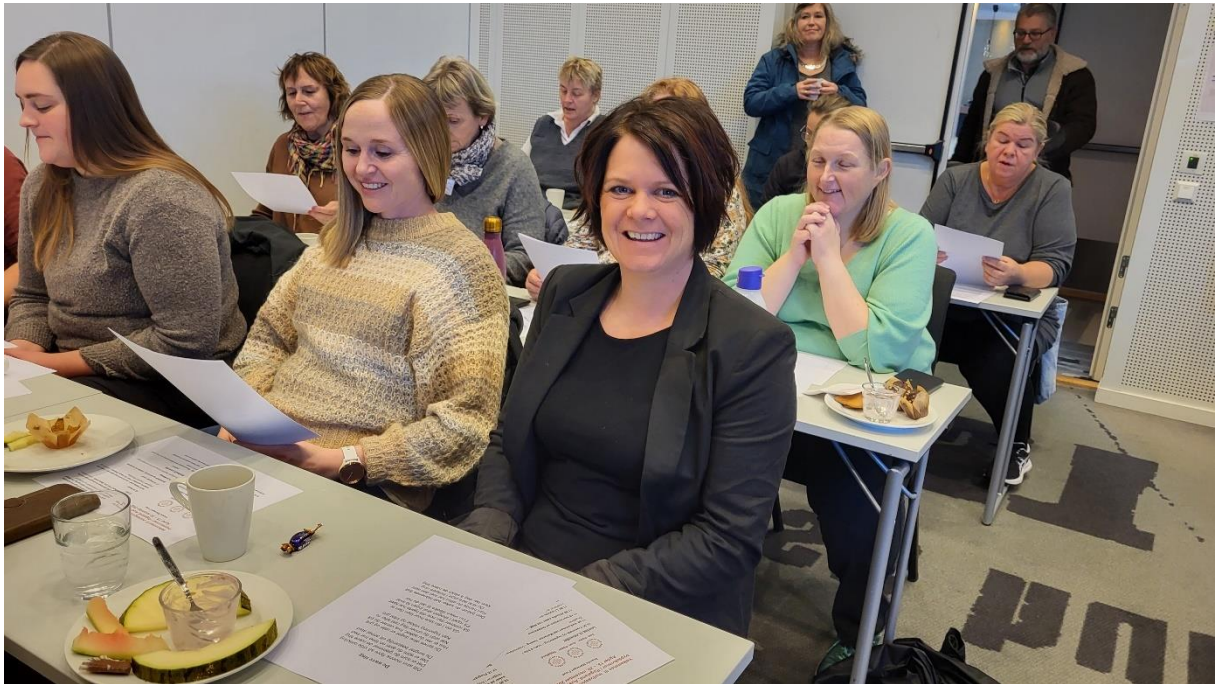
God stemning med song på samlinga

Deretter vart det presentasjonen av fylkesstyret i Rogaland, samt dei frammøtte bygdekvinneene frå dei ulike lokallaga.