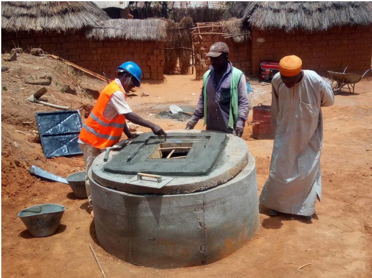
Ny brønn i Ndippele.

Det ble gravd to brønner, en i en bydel i Sambolabo og en i landsbyen Ndippele ca. 4 mil sør for Sambolabo. Kostnaden med ein brønn ligg på rundt 15.000 kroner pluss eigeninnsats frå folk i den aktuelle landsbyen.