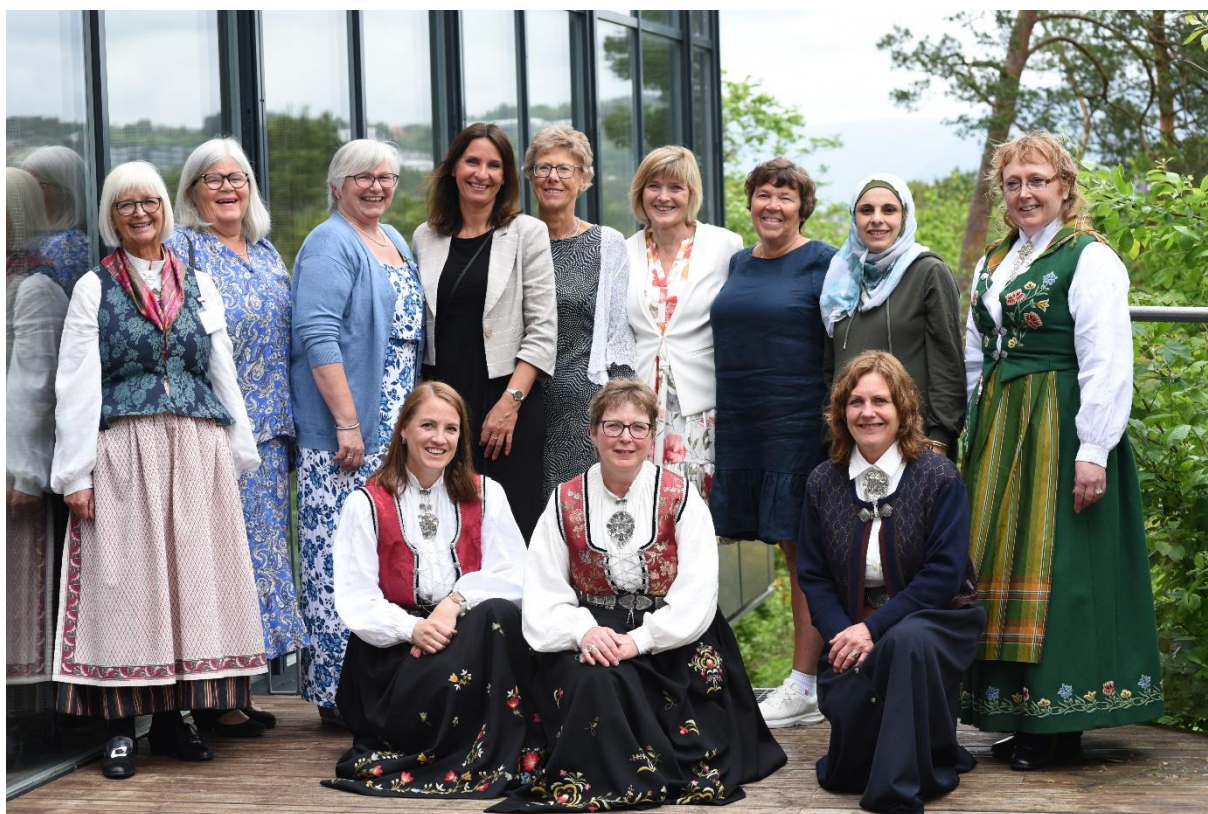
Rogalandsbenken på Bygdekvinnelagets landsmøte i Bergen