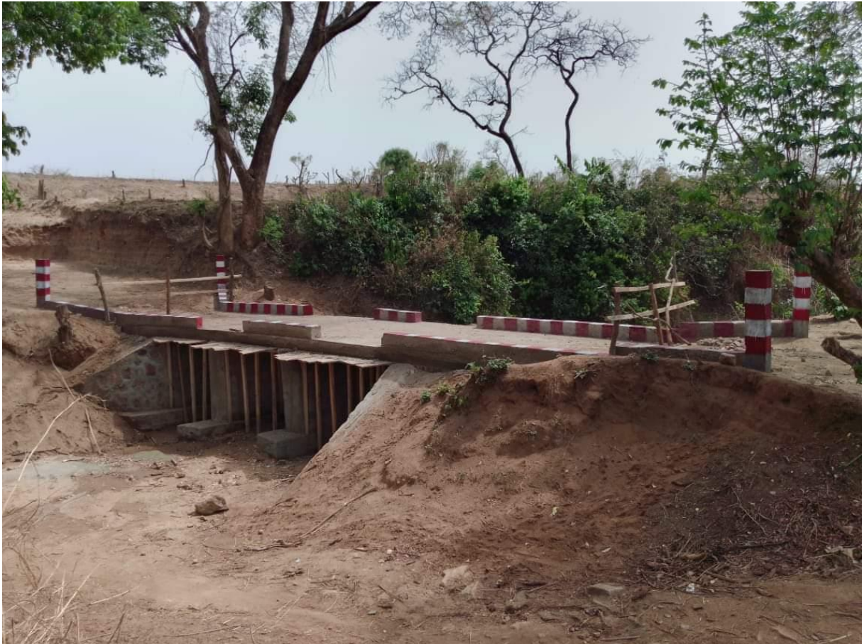
Nystøpt bru over Mayo Daki