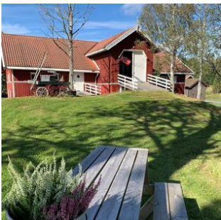
Låven med sjarm