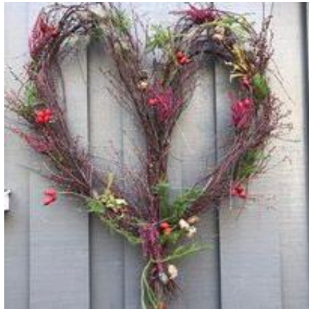
Et hjerte til glede