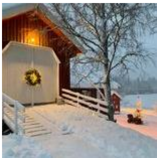
Vi venter på nissen