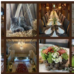
Til gleder og sorger