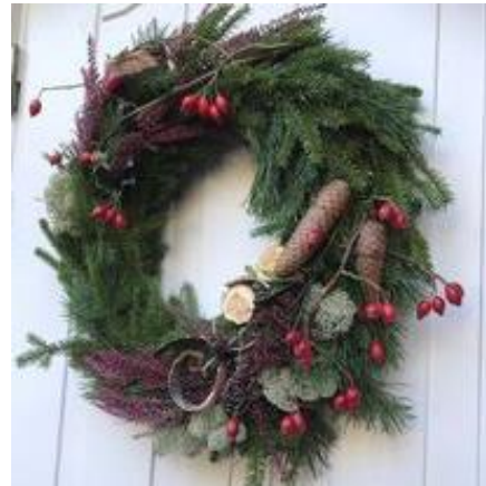
Vi venter på julen