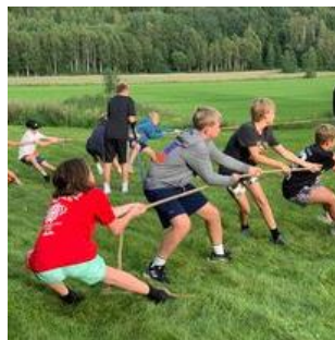
Stor tumle plass