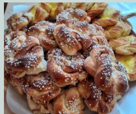
Deilige wienerbrød og kanelnurr