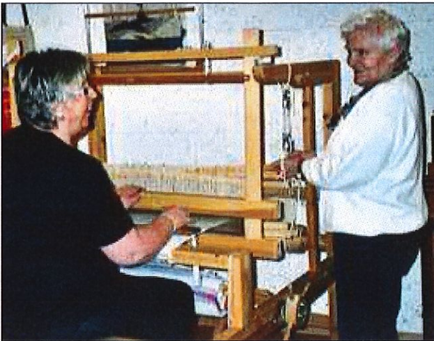
I veven. 24. feb. 2007.

I den anledning fekk bygdekvinnelaget i oppdrag å pynte ved kyrkja. Og der vart det fint! I 2004 starta fellesturane opp, og det kunne bli opp til 33 turar i året med varierende deltaking, men mange var trufaste og er det den dag i dag.