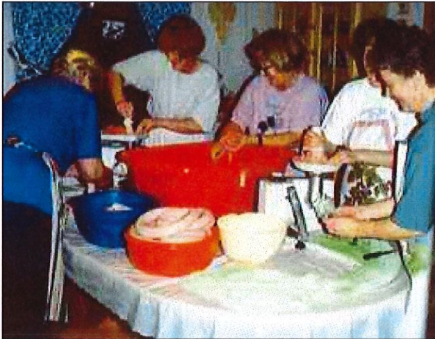
Laging av morrpølse november 1995.