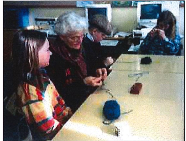
Strikkekurs på Solem skule våren 1998.