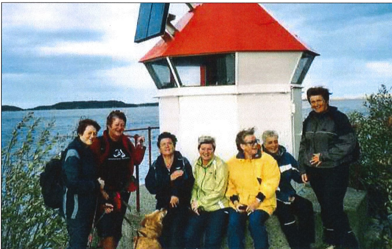
Tur til Julholmen 25.september 2007

laging og kakebakst ein dag. Kjekt å vere i lag med dei unge! Lefsebaking for sal og smaking hadde laget og ute på Løvikremma ein dag før jul. Det største dette 10-året var likevel at vi i 2003 fekk kulturprisen av kommunen! Hadde vi verkeleg gjort oss fortent til det? Vi kunne berre takke og gle oss over at bygda, ja heile kommunen såg verdien i det vi gjorde. Og Kongen og Dronninga kom til Gossen.