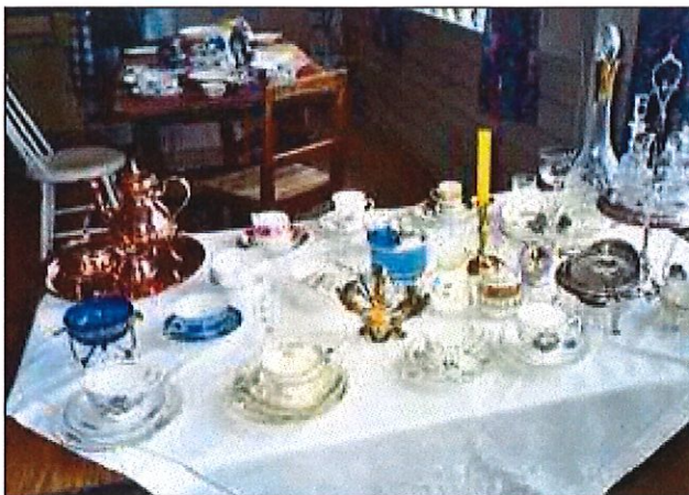
Utstilling av gamle kjøkkenting, mars 2003.

Eit stort kulturarrangement hadde laget og på Løvikremma. Masse flott handarbeid vart lånt inn, gamalt og verdifullt. Ja, så redde for at noko skulle hende med gjenstandane var