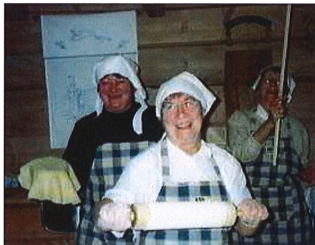
Lefsebakst på Løvikremma 2003.

Saman med flyktningar frå Bosnia og Sri Lanka laga vi innvandramat på Løvikremma. Medlemmar var med å laga mat 17.mai og på kulturminnedag. I 2002 hadde Tempo Lett si bygdekomedie på Løvikremma, og vi hjalp til med kostymer og stod for matsal dei dagane førestillinga gjekk. Minnelunden fekk sitt stell. To medlemmar var og på Riksfjord skole ein dag og bakte lefse saman med elevane. På skolen deltok vi og med kleppsuppe-