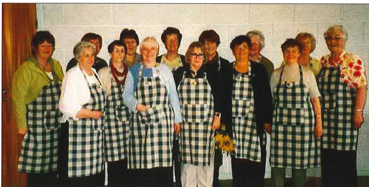
Bygdekvinnene i 2006.