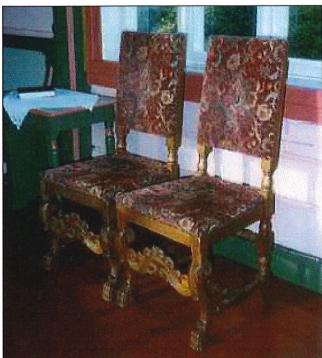
Brudestolar gitt til kyrkja i 1965 og 1981.

Etter 5 år som lag, kjøpte dei inn den første brudestolen til kyrkja, eller – ein ny brudestol, den andre kom etter i neste tiårs bolk. Men mykje vart gjort før det. Dei stod på for bygda, men ville og skolere seg sjølve på ulike felt. Dei sette i gang mange kurs for medlemmane.