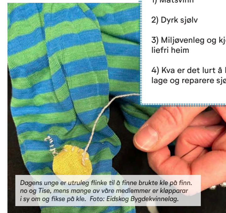
Dagens unge er utruleg flinke til å finne brukte kle på finn.no og Tise, mens mange av våre medlemmer er kløpparar i sy om og fikse på kle.