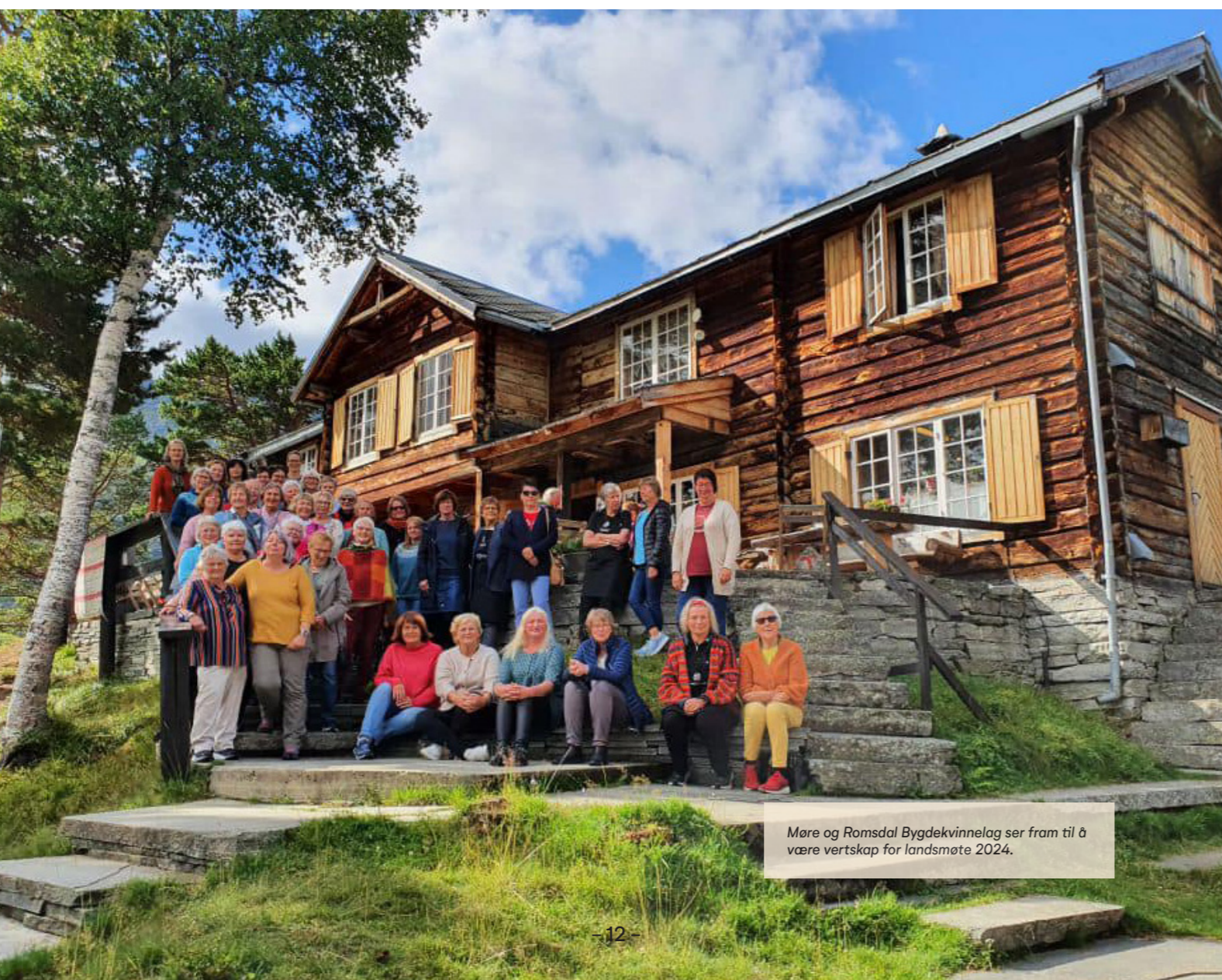
Møre og Romsdal Bygdekvinne­lag ser fram til å være vertskap for landsmøte 2024.

På kulturkvelden fredag blir vi bedre kjent med musikerne fra Bandet Vaffeltausene.