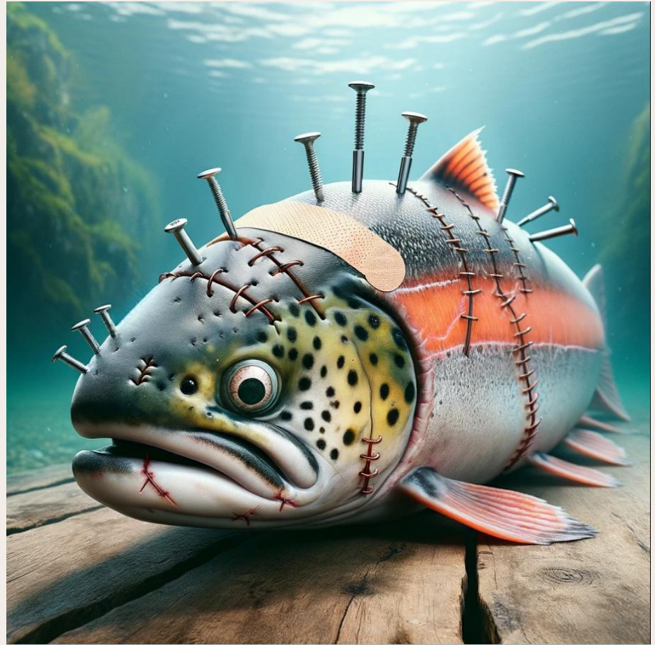
Illustrasjon: Thomas Iversen/Dall-E