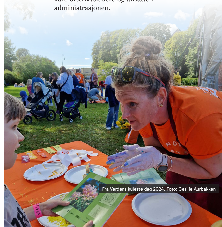
Fra Verdens kuleste dag 2024.

Sist, men ikke minst: alle instruksjonsvideoene til Norsk Tradisjonsmat finner du her.