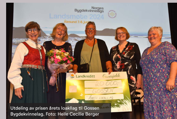
Utdeling av prisen årets lokallag til Gossen Bygdekvinnelag.

Prisen er på kroner 20 000,- og går til et lokallag som har gjort en god innsats i 2024. Send forslaget til deres distriktslag innen 1. mai 2025. Nærmere om kriterier og utfylling av skjema legges ut i organisasjonsbiblioteket . Årets lokallag vil bli kåret på inspirasjonsseminaret på Lillehammer 14.-16. november 2025.