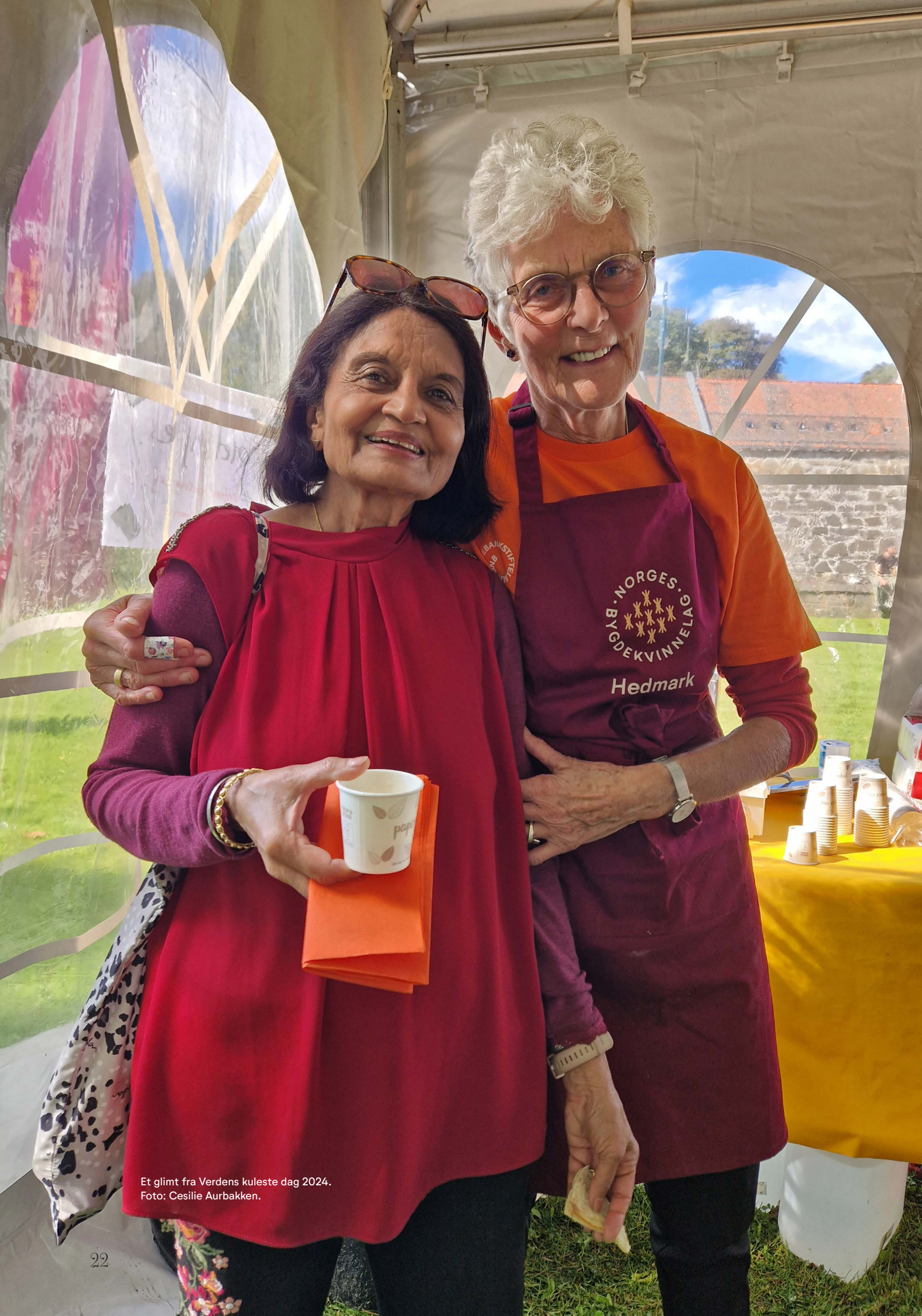
Et glimt fra Verdens kuleste dag 2024.