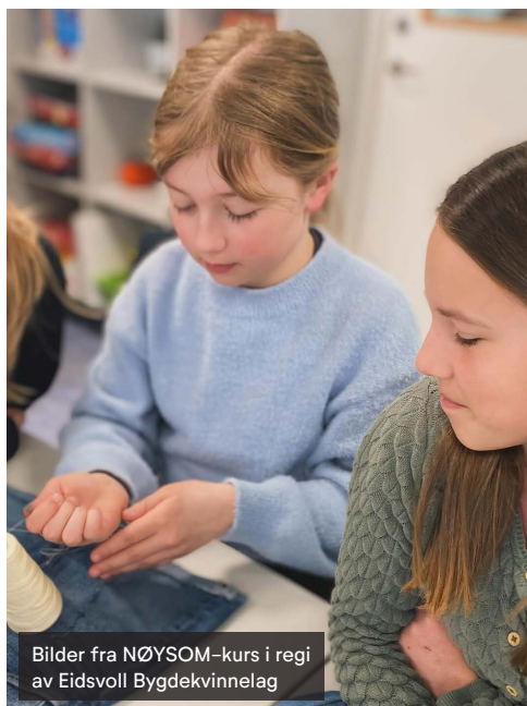
Bilder fra NØYSOM-kurs i regi av Eidsvoll Bygdekvinne lag

Utover våren 2025 vil det bli invitert til webinarer for alle medlemmer hvor vi setter fokus på temaene i prosjektet NØYSOM. Så følg med.