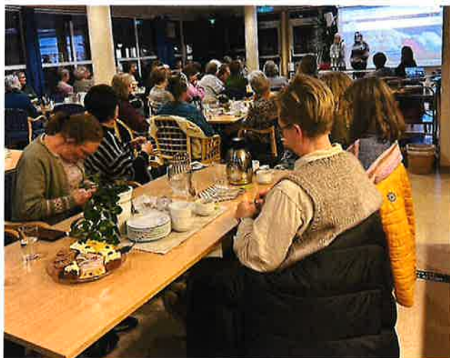
Figur 1 Foto Tora: Vinterkveld med stikketøy og underholdning.

Telemark Bygdekvinne­lag arrangerte også dette året Vinterkveld på Ulefoss. Omlag 60 damer fra hele fylket deltok. Det ble servert kaffe og kaker, og mange hadde med strik­ketøy.