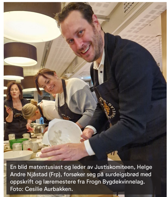
En blid matentusiast og leder av Justiskomiteen, Helge Andre Njåstad (Frp), forsøker seg på surdeigsbrød med oppskrift og læremestere fra Frogn Bygdekvinnelag.

Et tips til det politiske arbeidet er å la mat være en rød tråd for aktivitetene dere planlegger. Enten det er å lage mat i naturen for å snakke om viktigheten av friluftsliv i inkluderingsarbeidet, å samles til et felles måltid på den lokale skolen for å snakke om gratis skolemåltid, eller å ha et beredskapskurs for å vise viktigheten av praktisk matkunnskap, kan maten og måltidene være en aktiviteten som binder det hele sammen.