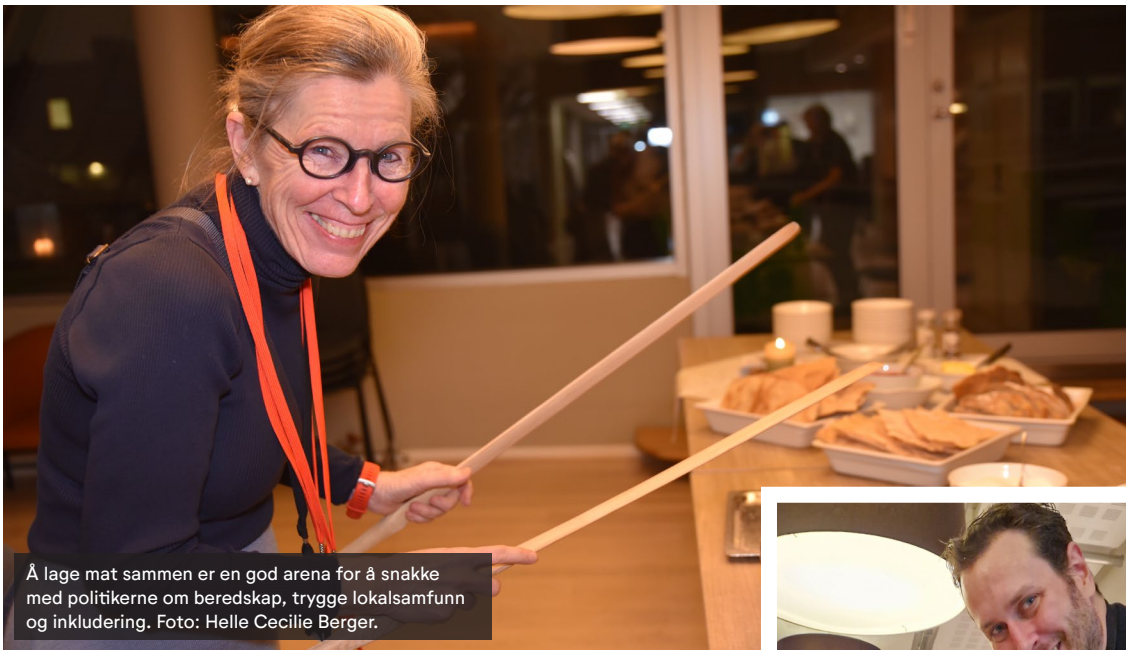
Å lage mat sammen er en god arena for å snakke med politikerne om beredskap, trygge lokalsamfunn og inkludering.