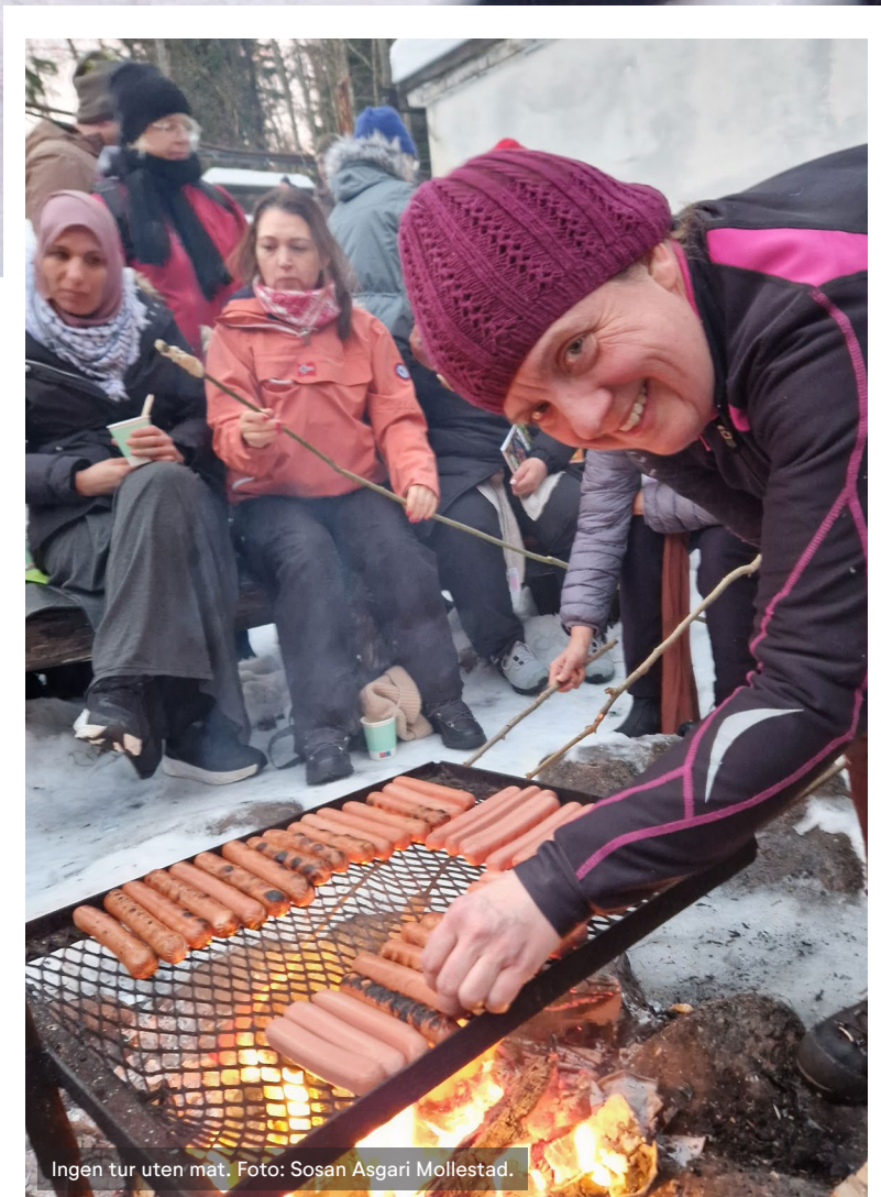
Ingen tur uten mat.

Frivillige organisasjoner er en viktig arena for inkludering og en bærebjelke i gode og trygge lokalsamfunn. Innenfor frivilligheten er det ulike møteplasser. Der møtes folk på tvers av sosiale ulikheter. Det bidrar til å skape gjensidig tillit og sosiale nettverk.