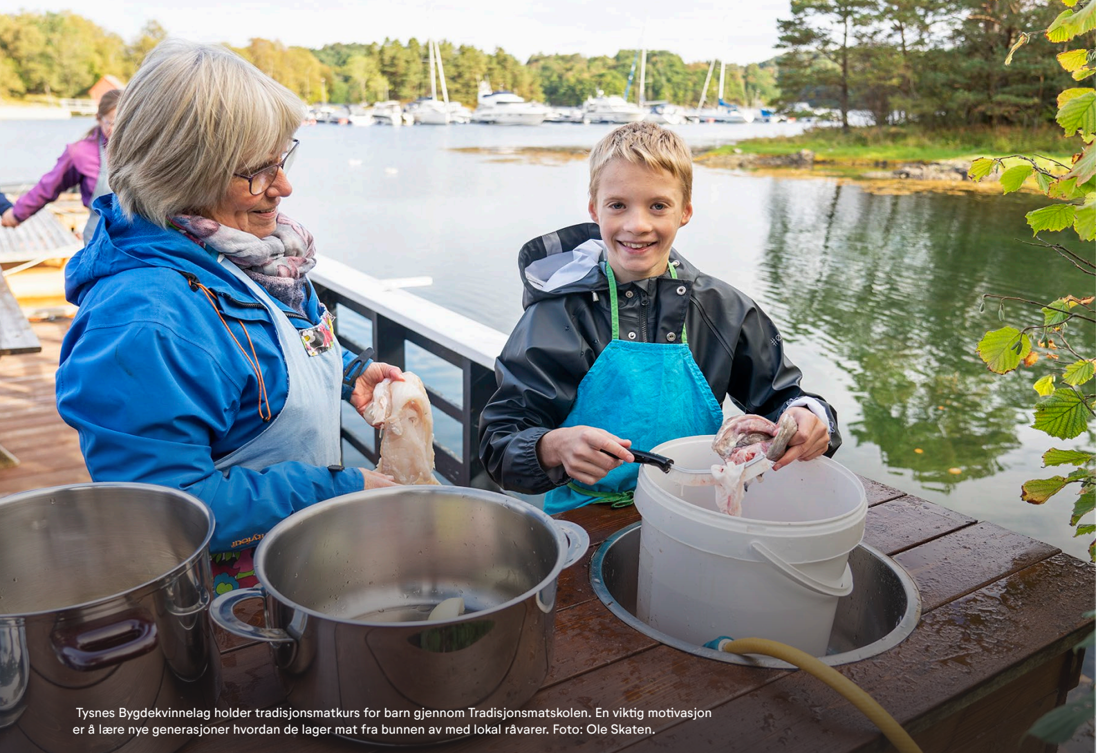
Tysnes Bygdekvinne­lag holder tradisjons­matkurs for barn gjennom Tradisjons­matskolen. En viktig motivasjon er å lære nye generasjoner hvordan de lager mat fra bunnen av med lokal råvarer.