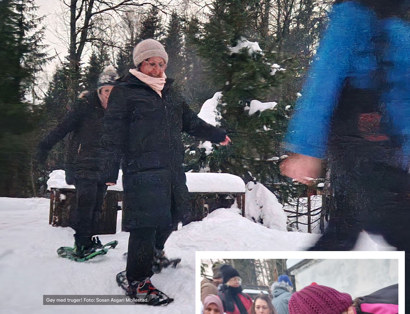
Gøy med truger!