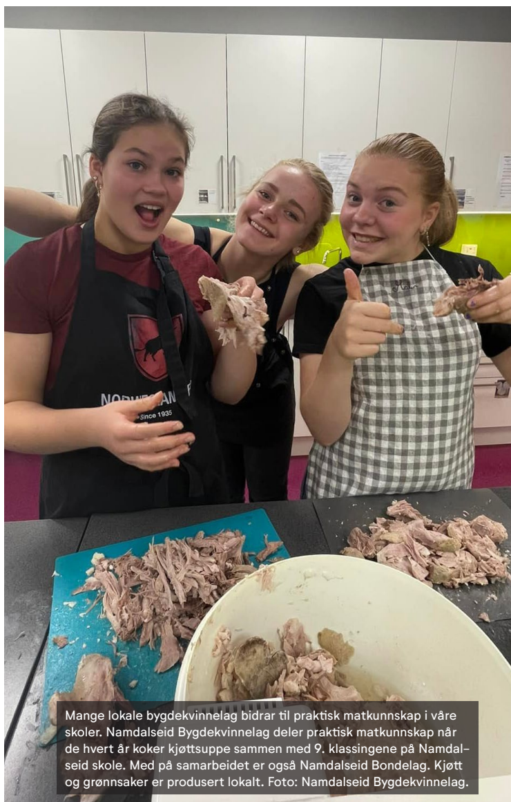
Mange lokale bygdekvinnelag bidrar til praktisk matkunnskap i våre skoler. Namdalseid Bygdekvinnelag deler praktisk matkunnskap når de hvert år koker kjøttssuppe sammen med 9. klassingene på Namdalseid skole. Med på samarbeidet er også Namdalseid Bondelag. Kjøtt og grønnsaker er produsert lokalt.