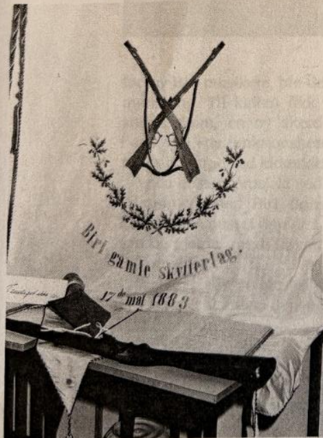
Fra Biridagene 1979.