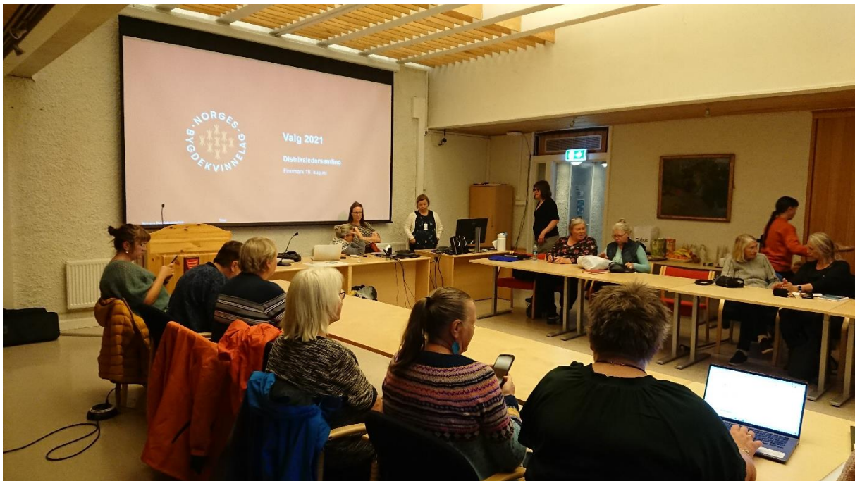
Distriktsleiar samling på rådhuset i Tana Bru

Dette var ein lærerik, sosial og minnerik tur som eg kjem til å leve lenge på. Tusen takk til både Norges Bygdekvinnelag og Tana Bygdekvinnelag for at de fekk dette til.