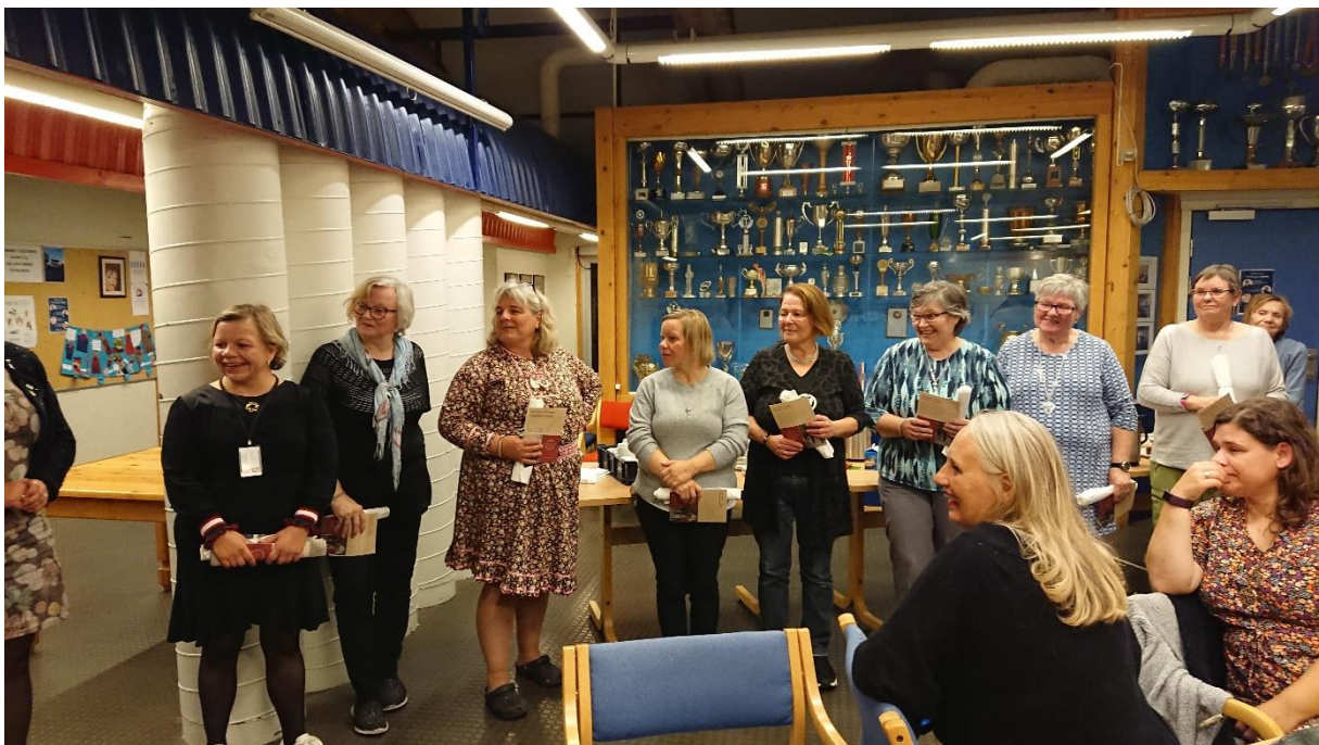
Tana Bygdekvinne lag var vertskap

Ettermiddagen på tysdag den 17. august møttest 30 damer i Alta. Nokre var kome med eit fly tidlegare, og nokre hadde vore der sidan helga før. Me blei presenterte for bussjåføren som skulle køyre oss dei første dagane.