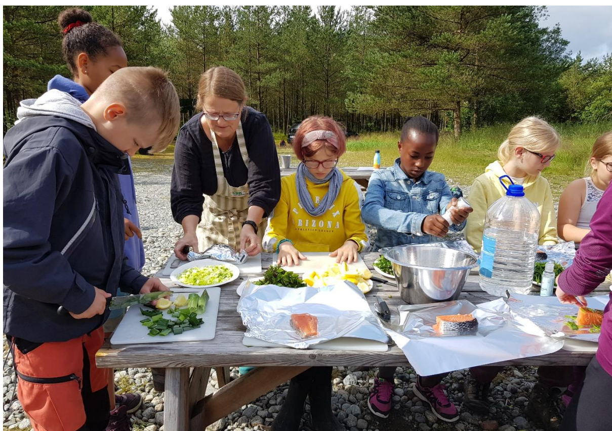
Koronatiltak i Suldal der Sand Bygdekvinnelag bidrog med matlaging ute i lag med elevane på sommarskolen