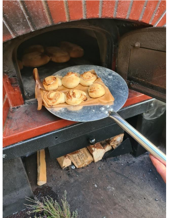
Bjerkreim Bygdekvinnelags pizzaog- prosjekt i BDMG