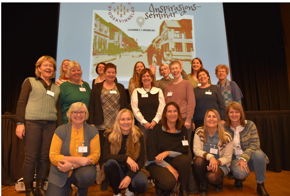
Rogalandsdelegasjonen på Inspirasjonsseminaret

Heile styret i Rogaland Bygdekvinnelag reiste saman til Lillehammer. Det fekk me eit omfattande og variert program. Eg refererer frå eit utval: