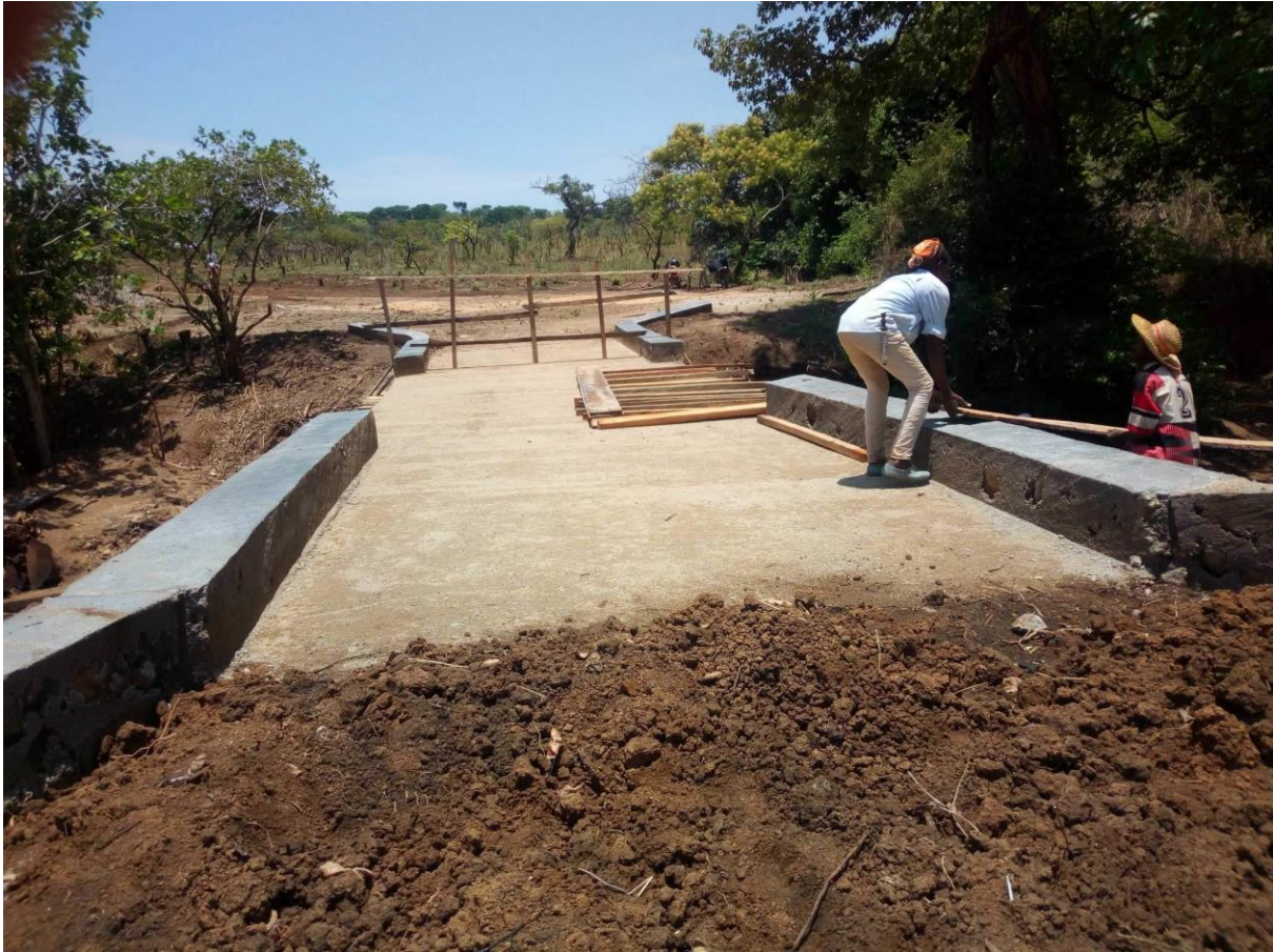
Ny bru over Mayo Djarandi