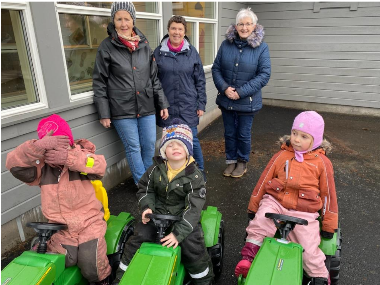
Skjold Bygdekvinnelag overleverte fire traktorar til Skjold barnehage. Gitt av Bygdekvinnelaget og Bondekompaniet Haugesund