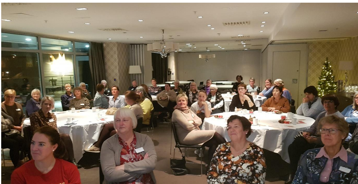
Forsamlinga følgde godt med frå forskriftsmessige runde bord

Alt i alt var dette ei vellukka samling. Styret fekk mykje positive tilbakemeldingar. Det gjorde godt å få vere saman. Tusen takk til alle som var med.