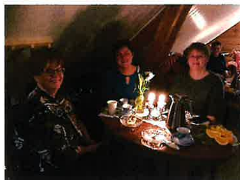
Deltakere på regionmøte på Heia og Kilnes gård