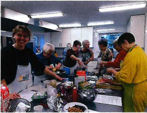
Mat av bygg i Sparbu BKL

Lokallagene har fulgt opp de nasjonale prosjektene på en utmerket måte. Vi er kjent med at det er aktivitet i Kvinner ut, organisasjonsskolen og tradisjonsmatskolen.