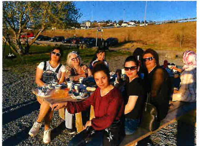
Skogn BKL har tur i fjæra

Norges Bygdekvinnelag sitt inspirasjonsseminar var i Trondheim 8.-10. november. 12 bygdekvinner fra Nord-Trøndelag var tilstede.