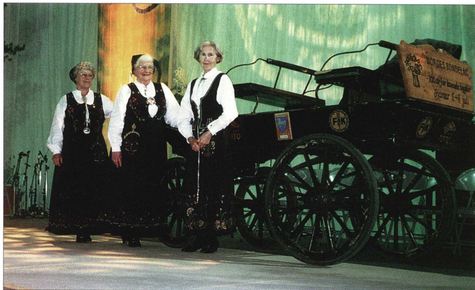
OVER: Våre deltagere i bunadparaden ved Norges Bondelags 100-årsjub. på Hamar. UNDER: Utstillingen vår på julebasaren i 1998 het kort og godt «Ull».