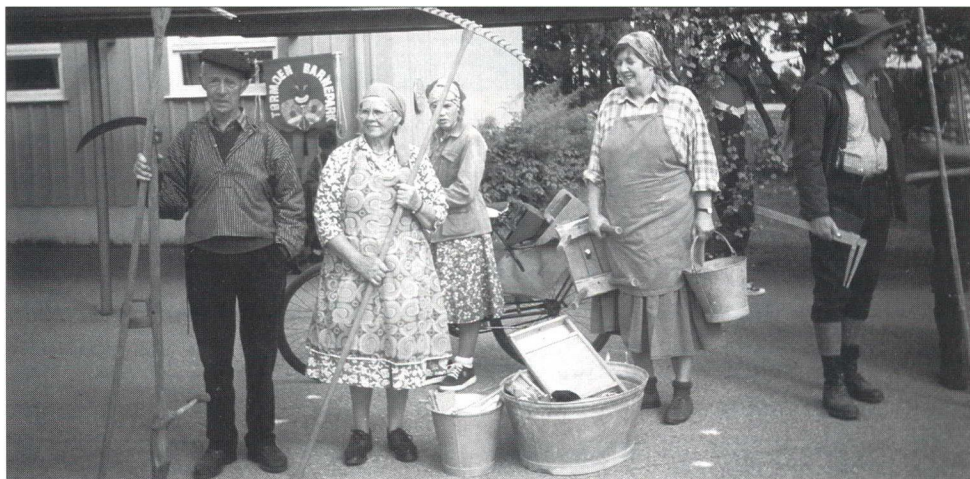
BRUJUBILEET i 1999: Arbeidsgjengen klar for avgang.

Hele det siste 10- året har medlemmene vært aktivisert i lagsarbeidet ved at laget har vært inndelt i 5 soner som har skiftet på om ansvaret for tema og underholdning på møtene. Dette har gitt mange fine innslag og har avlastet styret i stor grad.