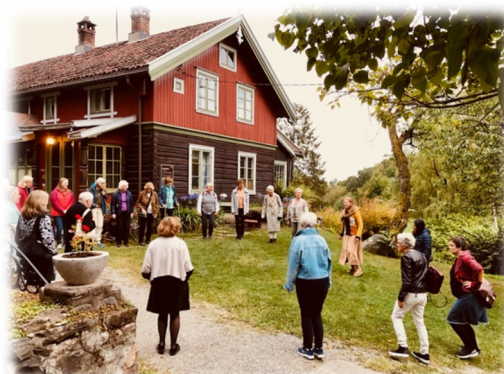
Deltakerne fikk omvisning på Asker Museum.

Medlemslag i sone 2: Asker, Lørenskog, Nittedal/Hakadal, Rælingen, Oslo og Bærum.