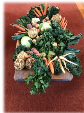
Et trau med markens grøde var dekorasjon til møtet.

Med mattrygghet menes at det er god kontroll med produksjonen av næringsmidler, slik at vi ikke blir syke av å spise maten. Det faglige ansvaret for mattrygghet i Norge ligger hos Mattilsynet, som er underlagt Landbruks- og Matdepartementet.